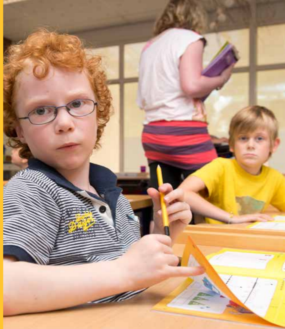
ALLE NAMEN EN SITUATIESCHETSEN ZIJN GERINGEERD. FOTO'S ZIJN WILLEKEURIG GEKOZEN.